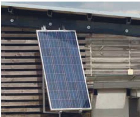
Impianti fotovoltaici per le case (magnitudo 4-5kWh)