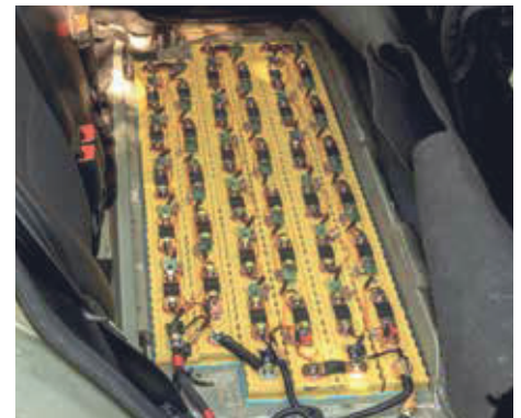
Punti di ricarica delle batterie o aree di stoccaggio