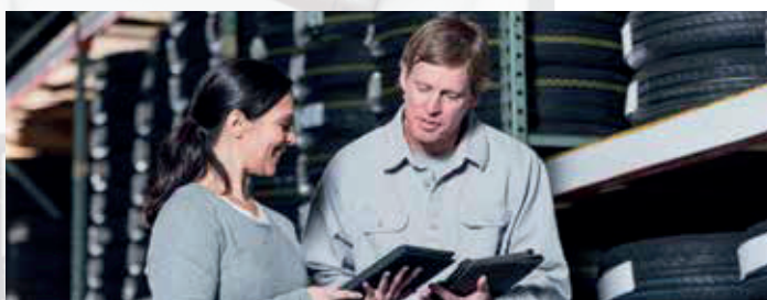
Produzione, lavorazione e stoccaggio della gomma, compresi i pneumatici.