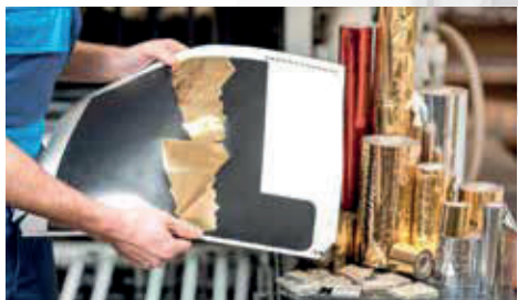
Lavorazione plastica e delle pellicole